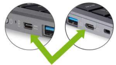
Designed for a reversible USB Type-C cable